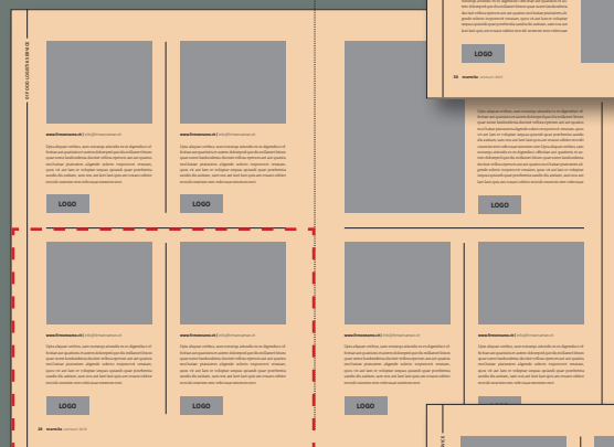
1/2 Seite 2 Einträge, je mit Logo CHF 2800.00