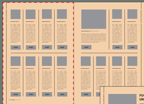
1/1 Seite 8 Einträge, je mit Logo CHF 4800.00